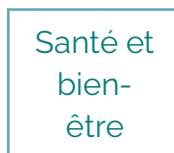
Santé et bien- être